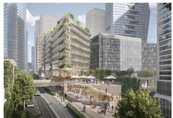
Perspective Projet Jean Moulin