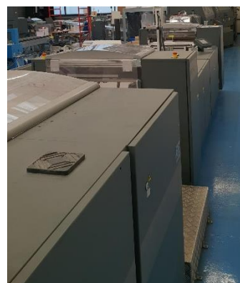
Presse jet d'encre Canon intégrée à une chaîne de finition Tecna 100% automatisée

Le groupe Dupliprint compte six filiales, dont la principale est Dupliprint . Celle-ci, représentant 88.6% de son Chiffre d'Affaires - avec 90 personnes, 17.5 millions d'euros de CA est une plateforme de services innovante.