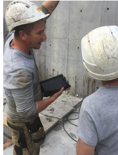
Projet Le Creuset – AWB : le BIM, une démarche numérique collaborative, de la conception à la réalisation