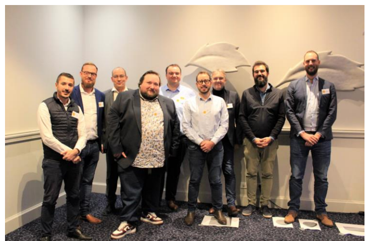
Les équipes de Spie batignolles et de CAD 42

Le croisement de ces 3 capteurs a permis de recueillir de précieuses données sur l'exploitation de la grue et d'identifier des développements à initier, notamment le lien avec le BIM 4D (planification) ou l'élaboration de tableaux de bords.